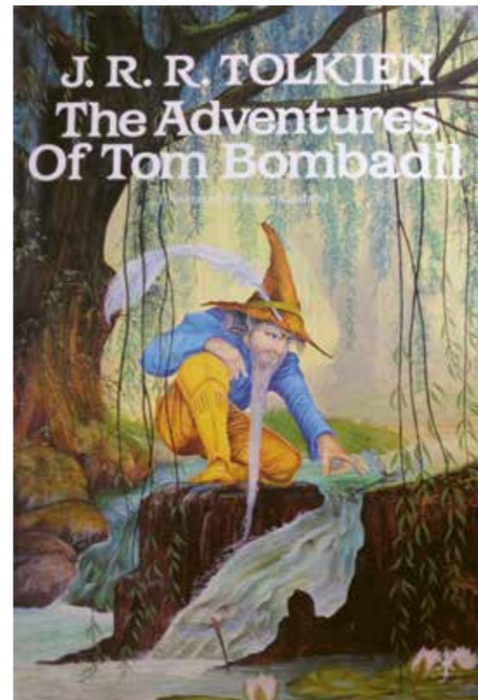
~ THE ADVENTURES OF TOM BOMBADIL , J. R. R. TOLKIEN, UNWIN HYMAN, 1990, ILLUSTRATION DE ROGER GARLAND.