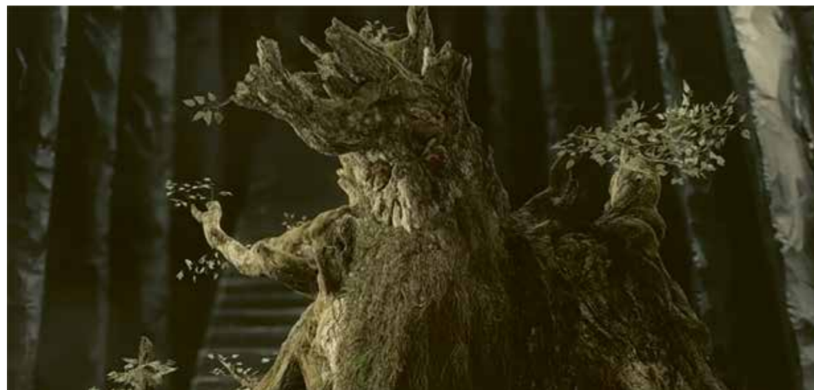
~ BARBEBOIS, LES DEUX TOURS , PETER JACKSON, 2002.

À l'instar des Ents, également très anciens, il se sent peu concerné par les problèmes du monde, même s'il entretient des relations de voisinage avec les habitants du Pays-de-Bouc (à l'est du Comté) et le fermier Magotte